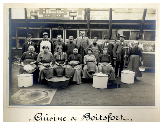
. Cuisine de Boitsfort .

De prioriteit gaat naar de kinderen. Naar voorbeeld van de schoolkantines van voor de oorlog worden dagelijkse soep en brood aangeboden aan de kinderen. De gemeenten voorzien in keukens en kantines in de scholen. Het lerarenkorps is belast met het opstellen van de lijsten met behoeftige kinderen.