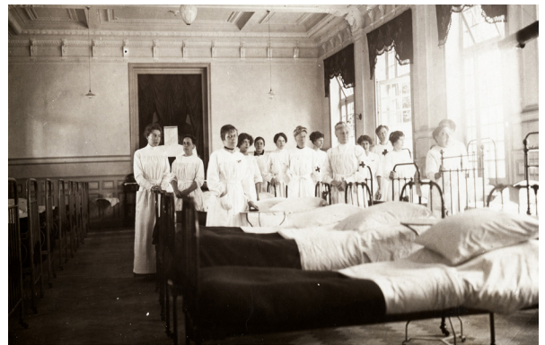
Foto: Ambulance in het Hooghuis, 1914