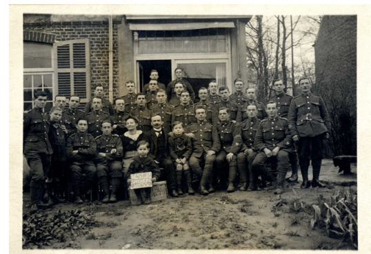
Foto: Geallieerde soldaten, Bosvoorded