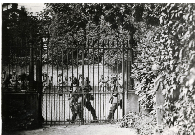
Foto: Duitse soldaten, Terhulpensteenweg, 1914

‘Ik naderde het voorportaal en zag de ongeluksbrengers.’